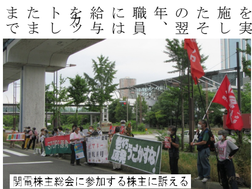
関西電株主総会に参加する株主に訴える

大阪地裁での第1回審尋は7月21日(火) 13時30分からです。13時に審尋前集会を地裁正門前で開き、入廷します。お集まりください。(K)