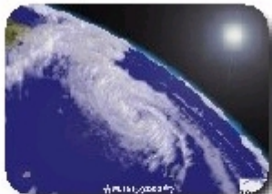
フィリピンの東海上で発生した台風10号の非静力学・大気海洋結合モデルによる予測シミュレーション