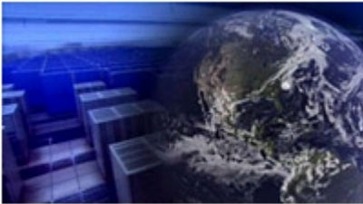
地球シミュレータと仮想地球

気候変動や気候変化という言葉が新聞やテレビだけでなく、政治家やテレビタレントの口からも出てくる時代である。二酸化炭素の排出を抑えれば世界の人類は温暖化の破滅から逃れることができるのだろうか？